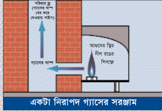
একটা নিরাপদ গ্যাসের সরঞ্জাম

আপনি যে ঘরে ঘুমান, সেই ঘরে যদি কোন একটা সরঞ্জাম, যেটা রুম-সীলড নয় (ঘরের দিকটা নিচ্ছিদ্রভাবে বন্ধ করা নেই), সারারাত জ্বালিয়ে রাখা হয়, তাহলে একটা বিশেষ ঝুঁকি থাকে। (রুম-সীলড জিনিষের থেকে গ্যাসের বাষ্প বের করে দেওয়ার পাইপটা সাধারণত: ছাদের কাছে না থেকে, বাইরের দেওয়ালে, নিচু জায়গায় থাকে এবং এটাকে একটা খাঁচা দিয়ে রক্ষা করা হয়)।