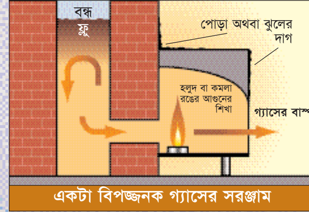
একটা বিপজ্জনক গ্যাসের সরঞ্জাম

সাবধান: গ্যাসের সরঞ্জাম এমন ঘরে যদি বাইরে থেকে হাওয়া ঢোকা বন্ধ করার ব্যবস্থা করা হয়, অথবা সীলিং বা এক্সট্রাক্টার ফ্যান, ডাবল গ্লোজিং অথবা ঘরের সাথে কনসারভেটরী লাগানো হয়, তাহলে তার পরে সেই এ্যাপ্লায়েন্সটা নিরাপদ কিনা তা পরীক্ষা করে দেখা